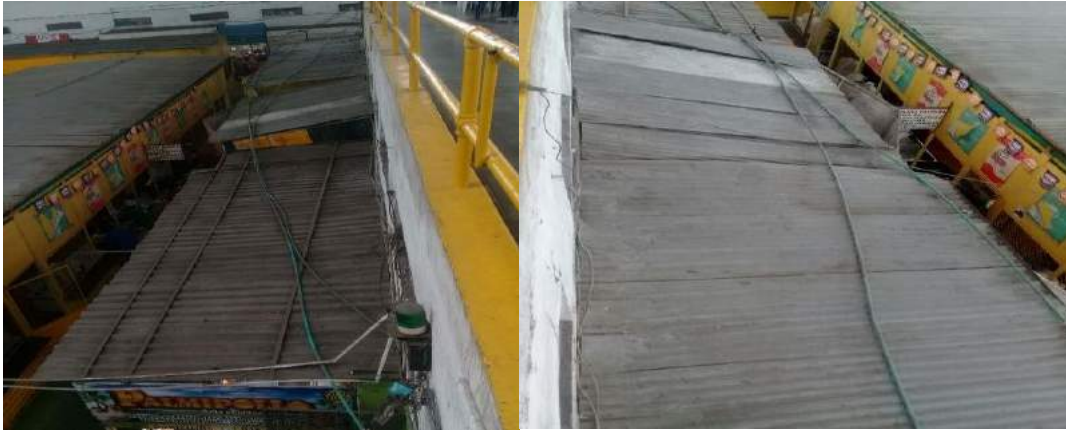
Jornada de aseo de las tejas de los módulos, plaza de mercado central.