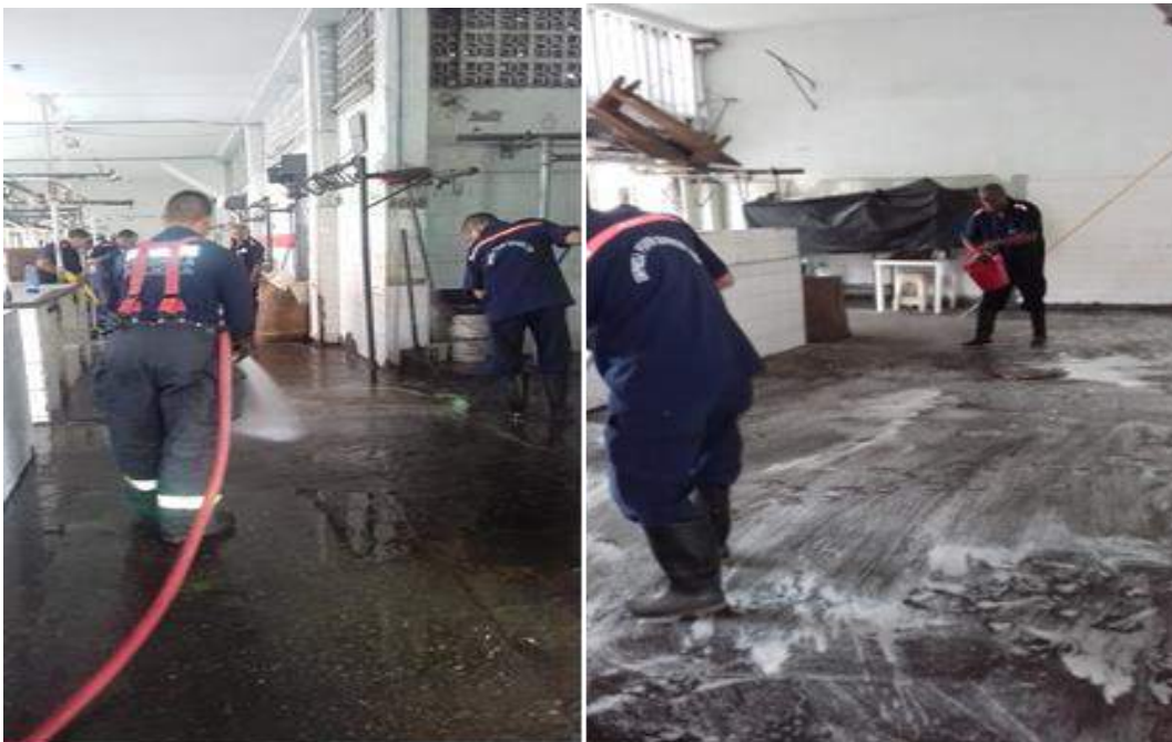
Jornada de aseo en las fajas de la plaza de mercado auxiliar.